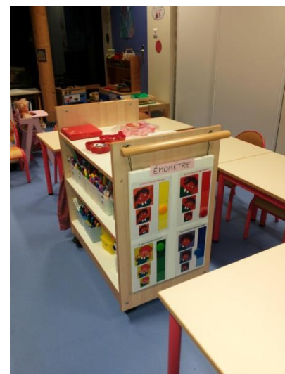
Le meuble des émotions

Lorsqu'il sent que cette émotion diminue, l'élève peut alors déplacer l'aimant, pour enfin le retirer si cette émotion a fini par disparaître.